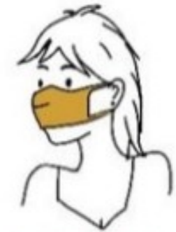
Au dessus du menton