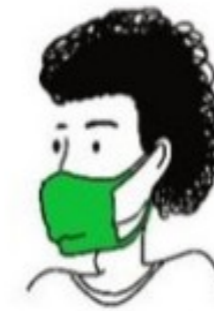
Pas assez serré