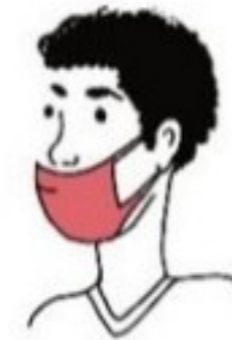
Sous le nez