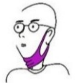
Sous le menton