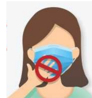
Toucher son masque